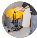
Einstellbarer und kompakter Saugbalken