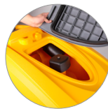
Sammelfilter für große Unreinheiten + Schutzfilter des Saugmotors